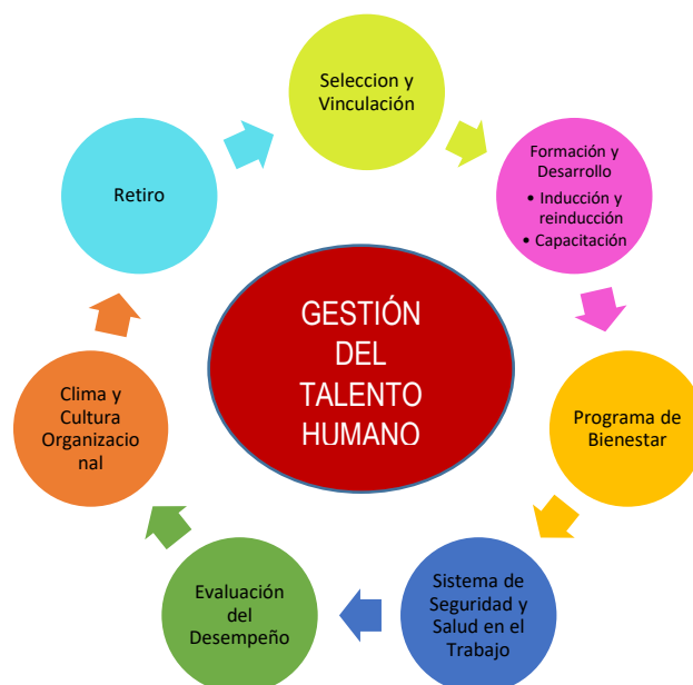
Figura 1. Ciclo Gestión del Talento Humano.

Para el Departamento Administrativo de la Función Pública – DAFP la planeación estratégica es un sistema integrado de gestión cuyo propósito es formular y planear las acciones que se requieran para garantizar el desarrollo integral a los servidores públicos de la Entidad y su articulación con la plataforma estratégica institucional (misión, visión, objetivos institucionales). Tiene en cuenta el ciclo de vida organizacional de un servidor público en sus diferentes etapas: ingreso, desarrollo integral, permanencia, situaciones administrativas y retiro, tal como se expresa en el siguiente diagrama: