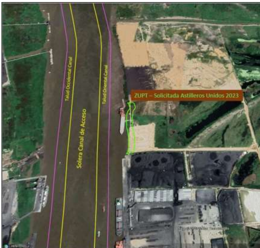
Figura 3. ZUPT Solicitada por “Astilleros Unidos” Año 2023