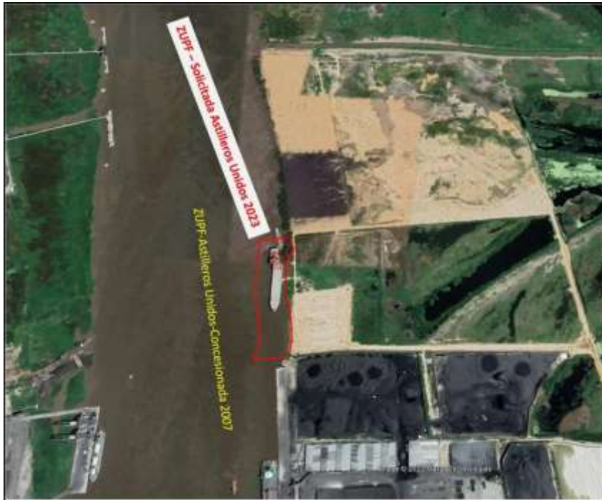
Figura 2. ZUPF Solicitada por “Astilleros Unidos” Año 2023

Al respecto, el CIIC no encuentra ningún conflicto de ocupación con el existente Canal de Acceso Conceptual Vigente.